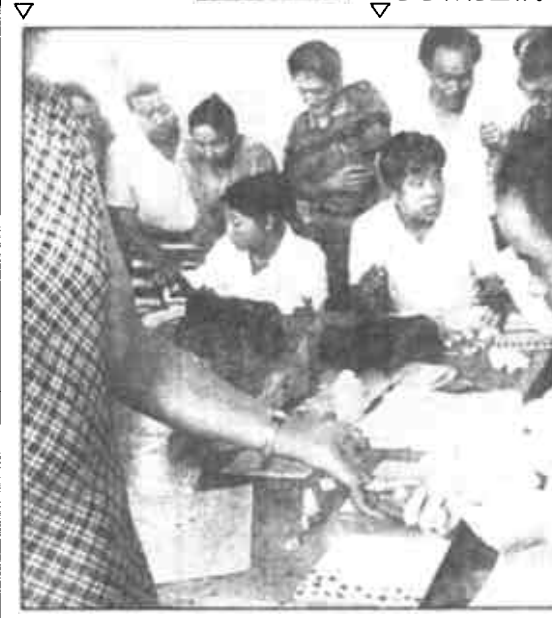
陈官乡为原“法轮功”练习者征订《东营日报》

日前，市中心血站前往广饶县李鹊乡采血，该县200余名机关干部、公职人员踊跃报名参加献血，以实际行动倡导救死扶伤、治病救人的良好风气，揭批“法轮功”的歪理邪说。