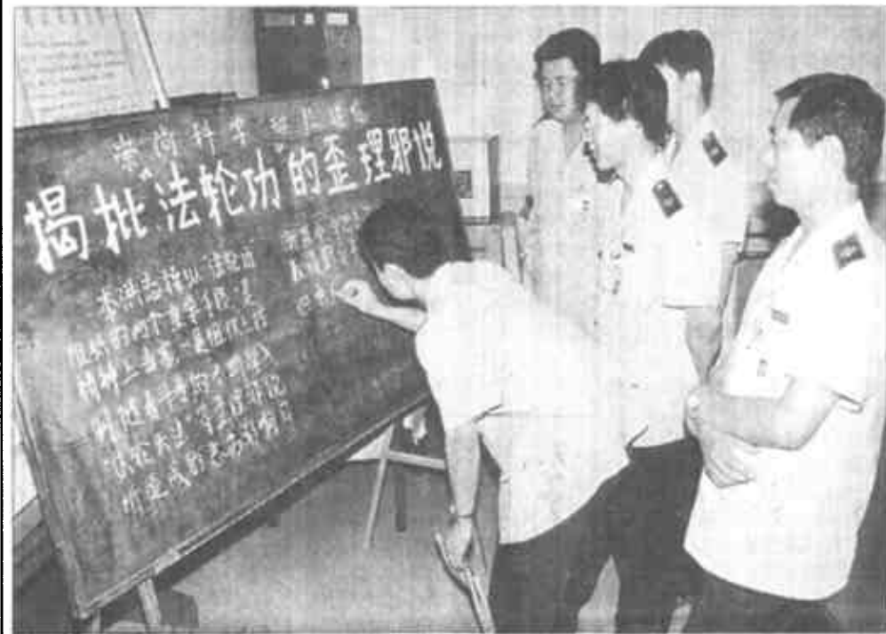
东营市国税局油田征收分局采取办墙报、黑板报等形式，深入揭批“法轮功”歪理邪说。